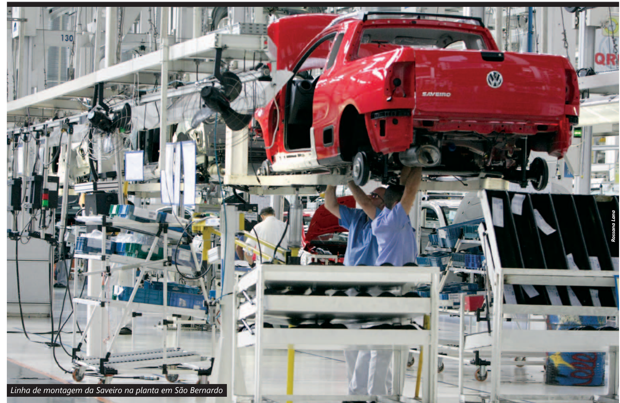
Linha de montagem da Saveiro na planta em São Bernardo